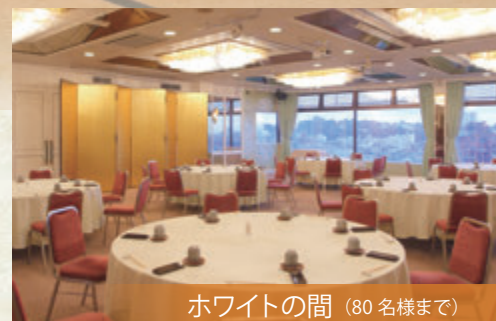
ホワイトの間 (80名様まで)