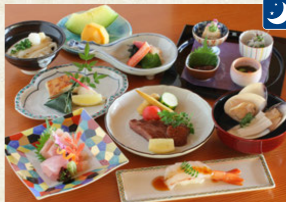
きらめき会席 8,800円(税込)

先附、お椀物、お造り、のど黒切り身塩焼き、 炙りポタン海老寿司、国産牛ヒレステーキ、 酢の物、氷見うどん、果物