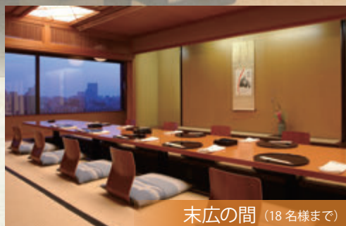
末広の間 (18名様まで)