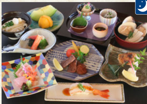
ときめき会席 11,000円(税込)

先附、お椀物、お造り、のど黒切り身塩焼き、 炙りポタン海老寿司、国産牛ヒレステーキ、 酢の物、氷見うどん、果物